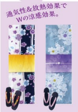
夏恋クール (税込) 17,064円

組み合わせは自由自在! 選べる3点セット ＜ゆかた(お仕立て上り品)+帯+下駄＞