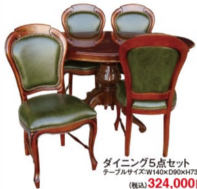
ダイニング5点セット テーブルサイズ:W140xD90xH73cm (税込) 324,000円