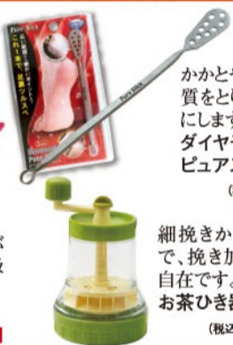
かかとや足裏の角質をとり、なめらかにします。ダイヤモンドピュアスリック (税込) 980円