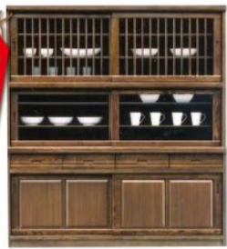
食器棚170 W170xD45xH184cm (税込) 105,840円