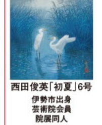
西田俊英「初夏」6号 伊勢市出身 芸術院会員 院展同人