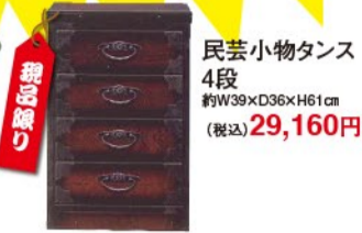
民芸小物ダンス 4段 約W39xD36xH61cm (税込) 29,160円