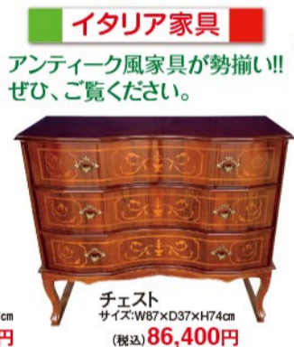
チェスト サイズ:W87xD37xH74cm (税込) 86,400円