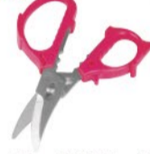
花の茎の導管がつぶれにくいので、水の吸い上げが良いです。花切かれず (税込) 2,138円