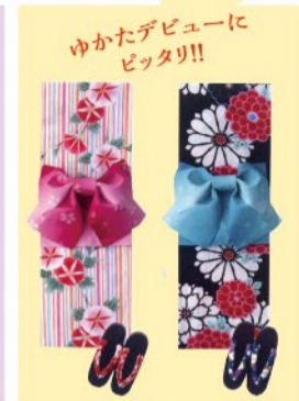
甘夏娘キュート (税込) 10,584円