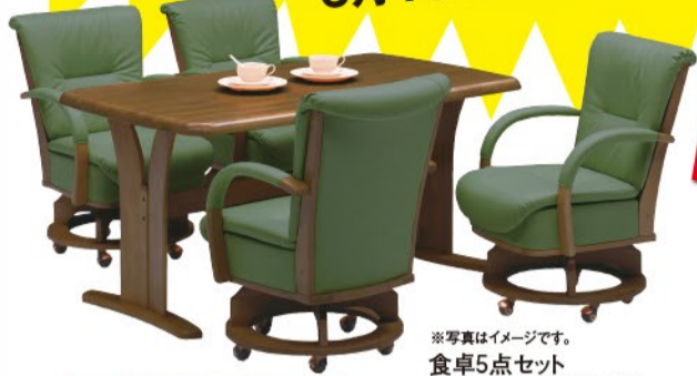
※写真はイメージです。 食卓5点セット テーブルサイズ:W150xD85xH70cm (税込) 85,320円

6月19日(水)~24日(月) 6階/催事場 ※最終日は午後5時に閉場いたします。