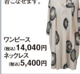
ワンピース (税込) 14,040円 ネックレス (税込) 5,400円

夏の婦人服期間限定SHOP ●6月19日(水)~25日(火) <1階/ウェルカムコート> 大胆なプリントをあしらったワンピースは1枚でオシャレに着こなせます。