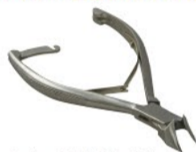
かたい爪も楽々切れる。一押しアイテムです。ドイツスタイル斜刃爪切り 日本製 (税込) 3,800円

家庭用からプロ用まで。刃物からキッチン用品・各種洗剤・美容小物まで、暮らしに役立つアイテムを豊富にご用意しました。