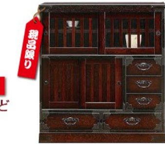
民芸飾り棚 約W90xD45xH97cm (税込) 73,440円