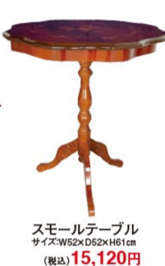
スモールテーブル サイズ:W52xD52xH61cm (税込) 15,120円